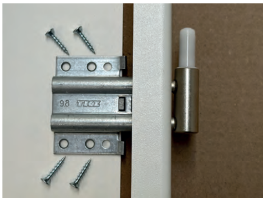
obrázek č. 1